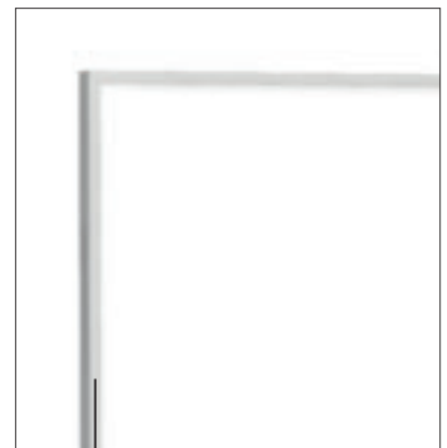
○ Eleganter extrudierter Aluminiumrahmen