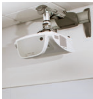
○ Für interaktive und Short Throw-Projectors