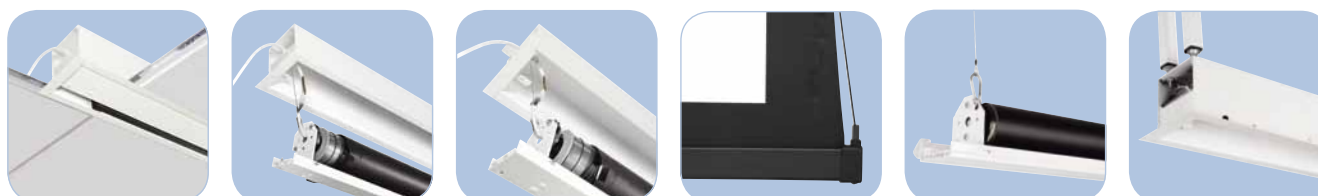
Perfekte Integrierung in der Decke Easy Serviceability Befestigung im Gehäuse möglich Fallstab bewegt sich in das Gehäuse Projektionstuch-Einbaukomponente Projektionstuchgehäuse